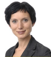
Lic. phil. Pascale Bruderer, Unternehmensberaterin, Nationalrätin SP